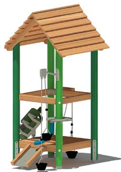
Neue Gestaltungselemente:

Der städtische Bauhof erhielt den Auftrag für den Abbau und die Entsorgung der Altgeräte inklusive des vorhandenen Fallschutzmaterials, sowie zum Aufbau der neuen Spielgeräte einschließlich Lieferung und Einbau des neuen Fallschutzes. Die Arbeiten sollen, sofern es die Witterungsverhältnisse zulassen, möglichst im März 2020 beginnen.