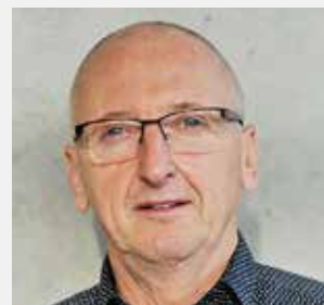
Roland Ockl Lieferservice