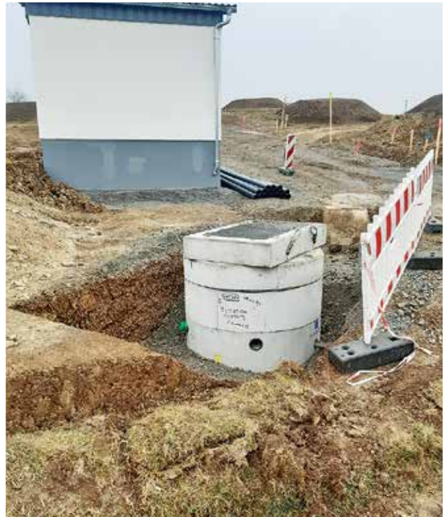
Foto: Trafostation mit Hebeanlage Quelle: Stadtbauamt Bad Neustadt a. d. Saale

Quelle: Stadtbauamt Bad Neustadt a. d. Saale