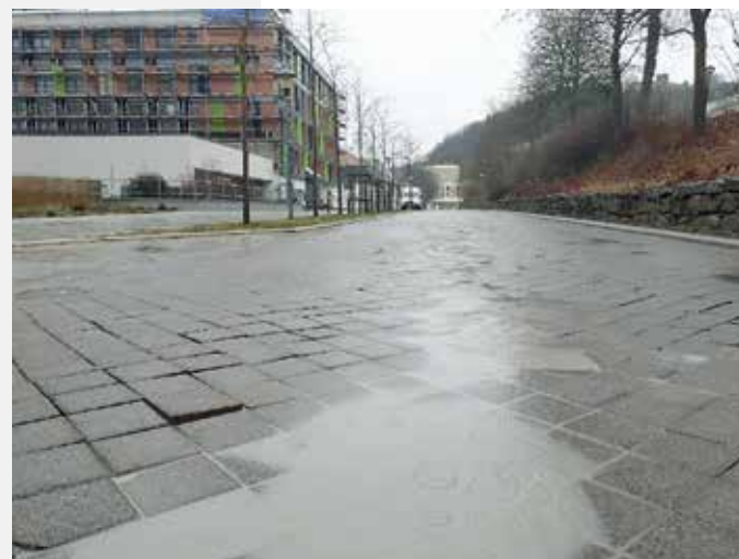
Fotos: Bestandssituation nach einem Regenereignis

Verhältnisse nur unter Vollsperrung ausgeführt werden. Während der kompletten Bauzeit wird die Schranke in der Promenadenstraße (in Richtung Herschfeld) geöffnet. Während des 4. Bauabschnitts (=blauer Bereich) wird zusätzlich die Schranke am Heuweg geöffnet, damit eine Umleitung über Dürrnhof möglich ist. Die Schranke in Richtung Löhriether Straße darf wegen des Wasserschutzgebiets nicht geöffnet werden.