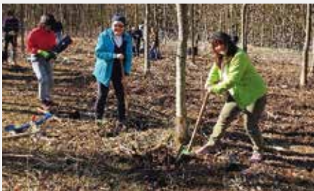
Schüler des Rhön-Gymnasiums beim Pflanzen der jungen Bäume

Da der Israel-Austausch des Rhön-Gymnasiums in diesem Jahr durch die Corona-Pandemie leider ausfallen musste,